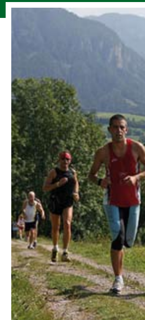
Obbligatori zainetto o marsupio con K-WAY e maglia di ricambio a manica lunga